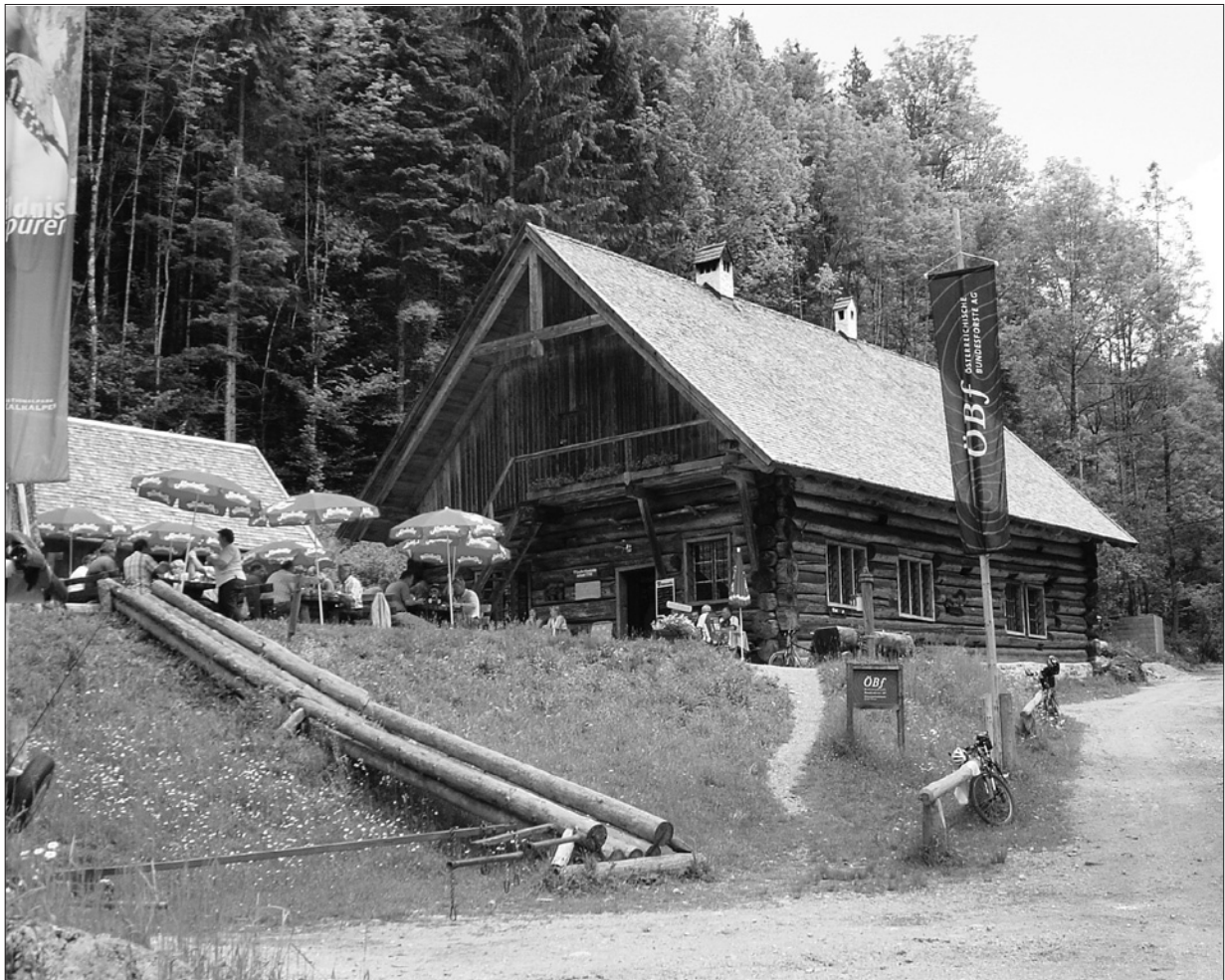
Sulzbacher Barock-Holz knecht-Hütte zum 10 Jahresjubiläum des Nationalparks revitalisiert Bundesforste bereichern den Nationalpark Kalkalpen um ein neues Ausflugsziel