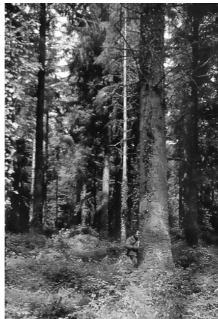
10x durchforsteter Bestand von Douglasie