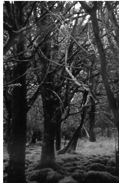
200–250jähriger Eibenbestand in Killarney

Der herrlich blühende Rhododendron, der aus dem Kaukasus stammt und über Algerien nach Irland kam, ist auch im 10.289 ha großen Killarney Nationalpark zur Plage geworden. Die Bekämpfung kostet dort 3.000 bis 4.000 €/ha, 50 Personen sind damit beschäftigt.