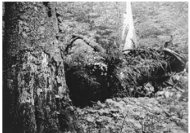
Urwald Boubin mit viel Totholz

staatlicht und das Rotwild hat sich bis nach dem Krieg stark vermehrt. Im Urwald ist durch den Wildinfluss die Verjüngung für 70 Jahre ausgefallen, deshalb hat man sich 1964 für die Zäunung des ganzen Urwaldes entschlossen. Seither gibt es wieder Verjüngung im Urwald, vor allem bei der Buche. Tanne und Fichte haben auch heute noch Verbisschäden, weil immer wieder tote Bäume auf die Zäune fallen und im Winter Rotwild über die nicht allzu hohen Zäune setzt. Rot- und Rehwild wird im Gatter abgeschossen oder ausgetrieben.