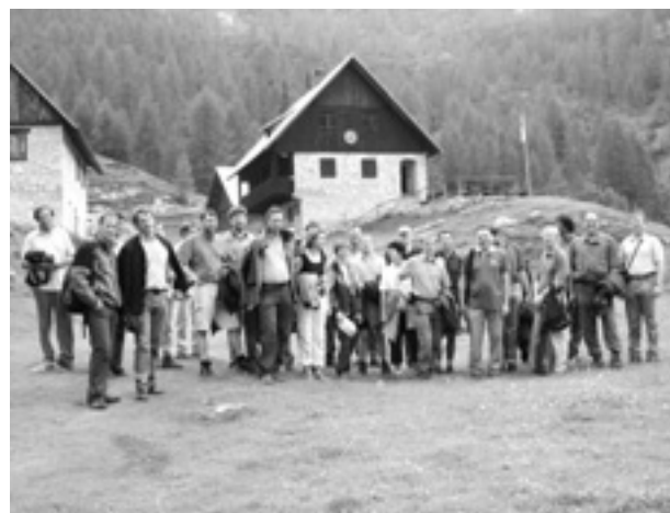
Teilnehmer der gelungenen Veranstaltung - darunter einige Försterkollegen- anlässlich der Exkursion in den Triglav-Nationalpark