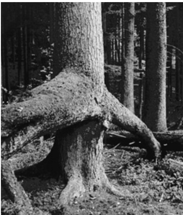
Fichte mit Stelzwurzel im Urwald Boubin

pen hinzu. 1972 kam es zu einer umfassenden Aufnahme, alle lebenden und toten Bäume wurden mit Baumart, Brusthöhendurchmesser, Länge und Besonderheiten (Bruch, Wurf, Zwiesel, Beule etc.) im geografischen Informationssystem, lagegenau aufgenommen und kartiert. Die Aufnahme wurde nach 24 Jahren 1996 wiederholt. 1996 standen im Urwald 10.842 lebende Bäume (Kluppschwelle 10 cm), - um 2.504 weniger als 1972 – und 6.035 tote Bäume, um 1.353 mehr. Vorrat an lebenden Bäumen 1996 35.997 fm, Totholzvorrat: 10.902 fm. Die Stammzahl hat von 1972 bis 1996 vor allem im mittleren und schwächeren Bereich abgenommen. Stark abgenommen hat der Tannenanteil von 693 auf 258 lebende Stämme, ähnlich ihr Vorrat. Der Gesamtvorrat ist beim lebenden, wie auch beim Totholz gestiegen. 1972 waren am Hektar 772 fm lebendes Holz und 234 fm Totholz, insgesamt 1.006 fm, das sind 23 % Totholz. Der Rückgang der Tanne wird teilweise auf Umweltschäden – Immissionen – zurückgeführt.