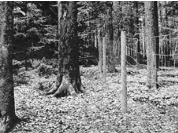
Plenterwald mit Zäunungsfläche in Jülbach, OÖ.

Das Land Oberösterreich fördert als einziges Bundesland den Erhalt der Plenterwälder mit 51 Euro je ha, Voraussetzung für die Förderung ist ein mindestens dreischichtiger Aufbau der Bestände und ein ausreichender Tannenanteil in der Verjüngung. Derzeit kommen 121 Besitzer in den Genuss dieser Förderung.