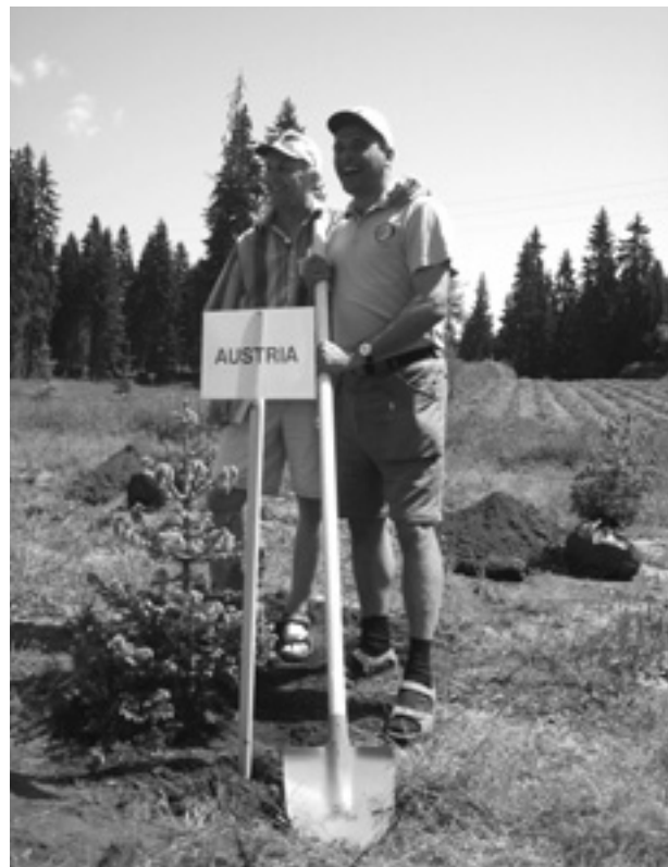
Der Vertreter Österreichs zusammen mit dem UEF-Präsidenten Hakan Nystrand bei der Baumpflanzung

Kirchenwald. Von 1950 bis 1975 kam es zu einer Übernutzung des Waldes. Von 1975 bis 1990 fand eine Normalnutzung statt. Seit 1991 kommt es zu einer Unternutzung.