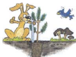
Tief genug versetzen