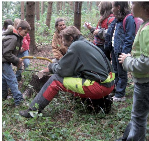
Waldpädagogik - eine wichtige und fröhliche Bereicherung unseres Berufsalltages, auch im Team z. B. mit dem Ehepartner

Hunderte Försterkolleginnen und -kollegen haben die viertägige Grundausbildung – heute Modul A – an einer der Forstlichen Ausbildungsstätten vor Jahren schon besucht, viele haben immer wieder Waldführungen veranstaltet, viele haben zwar Interesse an der recht lebendigen Arbeit mit jüngeren oder äl-